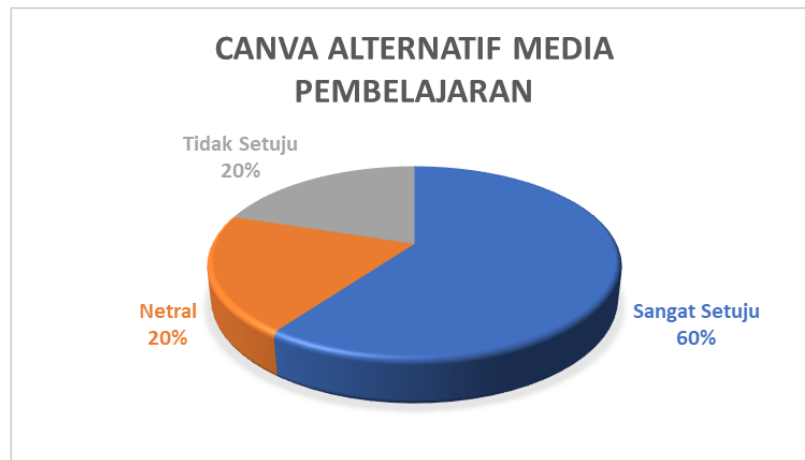
Gambar 3. Aplikasi Canva Alternatif Media Pembelajaran

Gambar 3. Aplikasi Canva Alternatif Media Pembelajaran menunjukkan bahwa mayoritas para guru sangat setuju bahwa Canva sebagai alternatif media pembelajaran di sekolah dengan porsi kuisioner sebesar 60%. Sedangkan beberapa guru memilih netral dan tidak setuju masing - masing sebesar 20%. Hasil pengabdian media pembelajaran menggunakan Canva menunjukkan bahwa peserta dengan mudah memahami dan menguasai Teknik dalam penggunaan Canva.