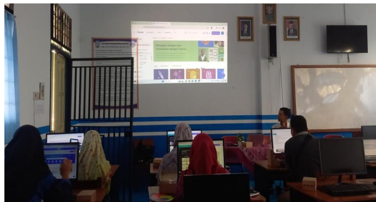
Gambar 1. Ceramah dan Pelatihan Canva

Kegiatan pengabdian kepada masyarakat dilakukan di SMK Muhammadiyah Batang pada hari Rabu, 22 Mei 2024. Kegiatan tersebut dilakukan secara tatap muka yang diikuti oleh para guru di SMK Muhammadiyah Batang Provinsi Jawa Tengah. Pelatihan ini diawali dengan penyampaian materi dan diskusi terkait fitur dan kegunaan aplikasi Canva. Tim pengabdian memberikan pemahaman kepada para guru bahwa Canva merupakan salah satu aplikasi desain yang mudah dalam penggunaannya dan gratis. Menurut Syafianti (2022) Canva merupakan suatu aplikasi desain terkini yang dapat di akses secara online yang menyediakan banyak menu seperti flyer , poster , banner , resume/CV , info grafis , presentasi .