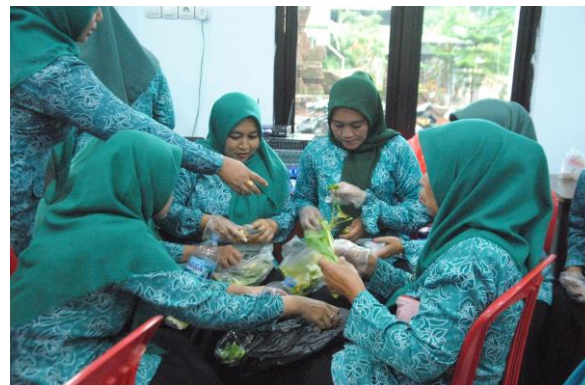
Gambar 3. Anggota PKK Desa Karangkuten menyiapkan bahan baku eco-enzyme