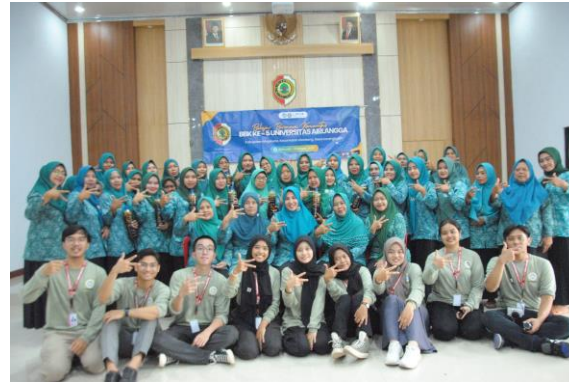
Gambar 2. Foto Bersama Anggota PKK Desa Karangkuten

meningkatkan kualitas lingkungan (Putri et al., 2023). Berikut dokumentasi kegiatan Ecozyme Action terlampir.