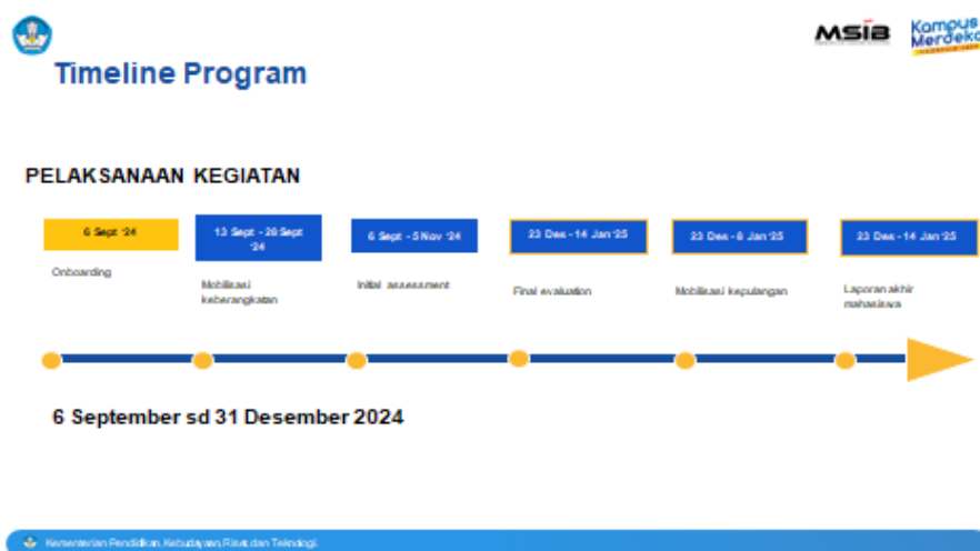
Gambar 1. Alur pelaksanaan kegiatan mahasiswa magang MBKM

Gambar 1 menjelaskan alur pelaksanaan kegiatan mahasiswa magang MBKM.