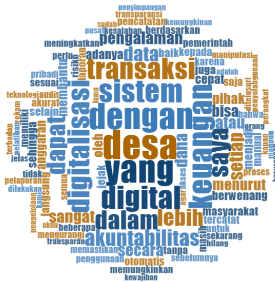
Gambar 2. Word Cloud Berbasis Hasil Analisis Penelitian